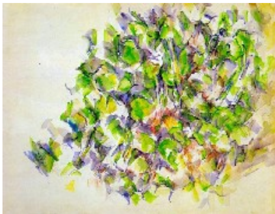
Laub, 1895–1900, Cézanne