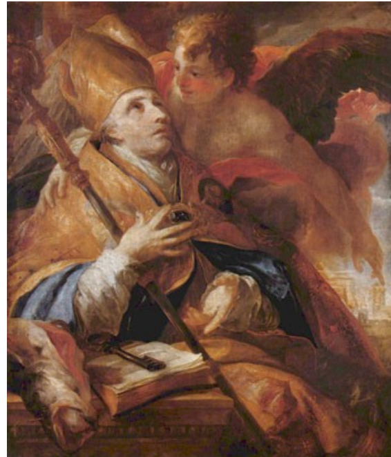
Der heilige Benno (16. Jh.), Johann Michael Rottmayr

Der Zauber kann vom Priester nur einmal pro Jahr angewandt werden.